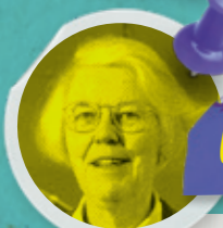
Karen Spärck Jones

Elle a réalisé l'un des tout premiers films de fiction, La Fée aux choux , en 1896. C'est la première grande réalisatrice et productrice. Les réalisations personnelles d'Alice Guy sont de plusieurs centaines de films, très courts, comme le sont tous les films à l'époque, et dans tous les genres possibles. Beaucoup de ses œuvres ont été perdues. Pendant très longtemps, elle a été effacée des livres d'histoire du cinéma.